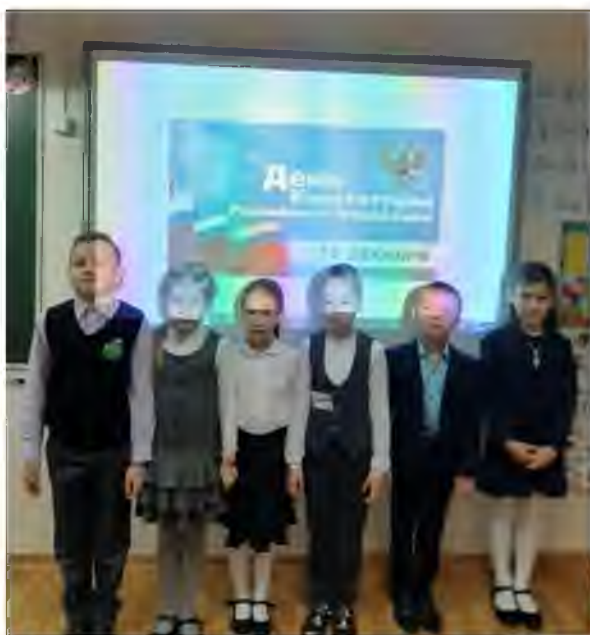
Единый урок прав человека «Конституция – основной закон государства» в 1 классе

01.12.2020 – Всероссийская акция «Стоп ВИЧ/СПИД», посвященный Дню борьбы со СПИДом -50 человек, 10-11 классы