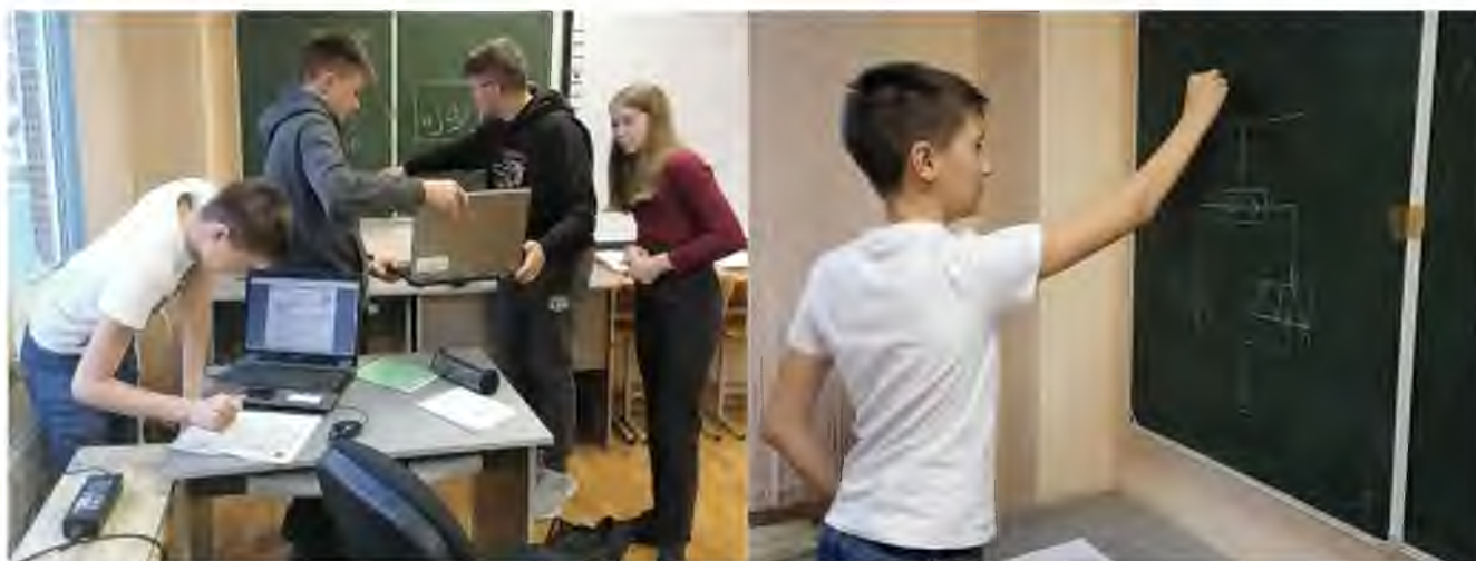
Занятия в рамках программы "Мехатроника", 8 классы

16.12.2020 ГБОУ лицей № 572 стал площадкой Международного игрового конкурса «British Bulldog». (61 обучающийся, 2-11 класс).