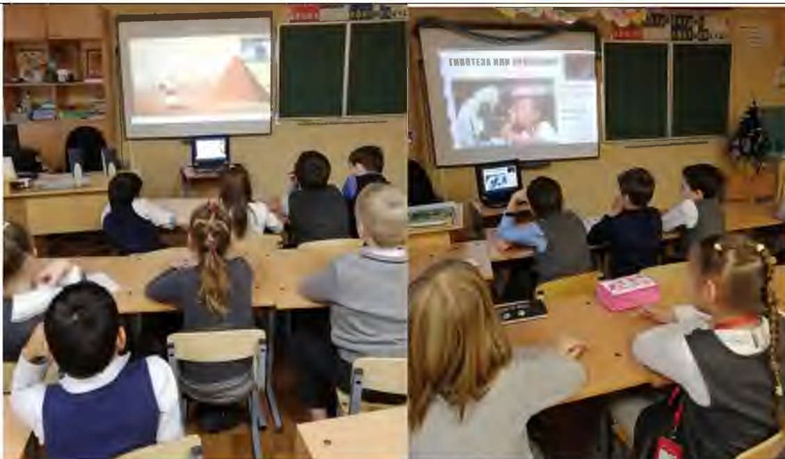
Занятия в рамках программы «Научная лаборатория», 3а и 4б классы