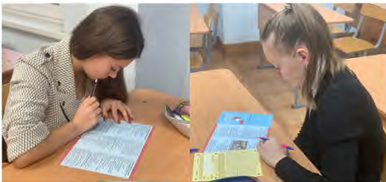
Международного игрового конкурса «British Bulldog»