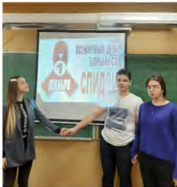
Урок ОБЖ «СПИД без мифов и иллюзий» в рамках Всероссийской акции «Стоп ВИЧ/СПИД» в 11 классе