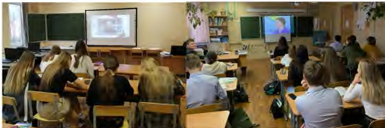
«Единый урок профессионализма»

09.12.2020- 18.12.2020 «Единый урок профессионализма» в рамках VI Открытого регионального чемпионата «Молодые профессионалы» WorldSkills Russia (7,8,10, 11).