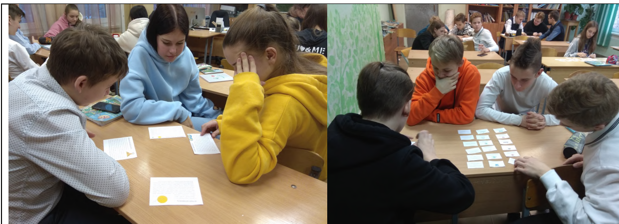
Урок «Изменение климата в России», 8а блага